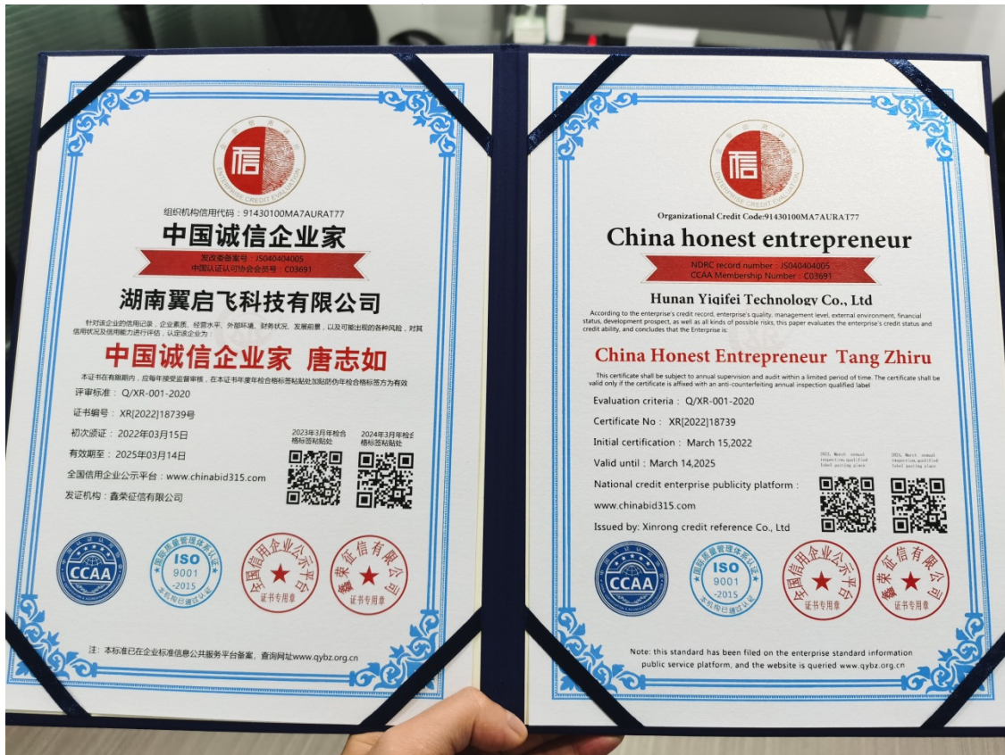
湖南翼启飞科技有限公司