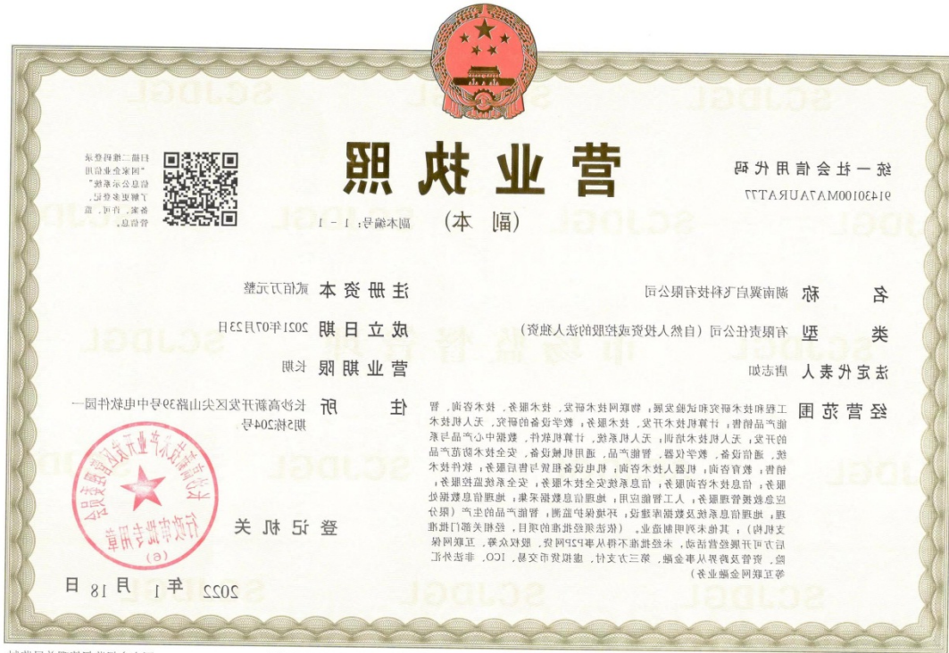
湖南翼启飞科技有限公司