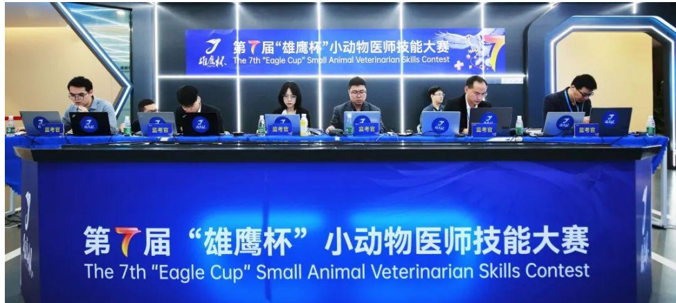
图 8 第七届“雄鹰杯”小动物医师技能大赛

各校进行示范观摩提供了宝贵的资料，高校学生实操能力的提升对于兽医行业的未来发展发挥着重要和深远的作用。