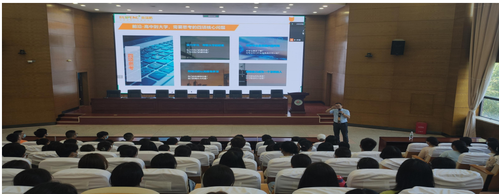
图7 湖南生物机电职业技术学院开学第一课

学校每年都会邀请本单位高管及专家到学校开展“开学第一课”专题做讲座，给学生进行行业现状与前景介绍、职业生涯规划与建议、就业创业指导与交流等方面的讲座与互动；