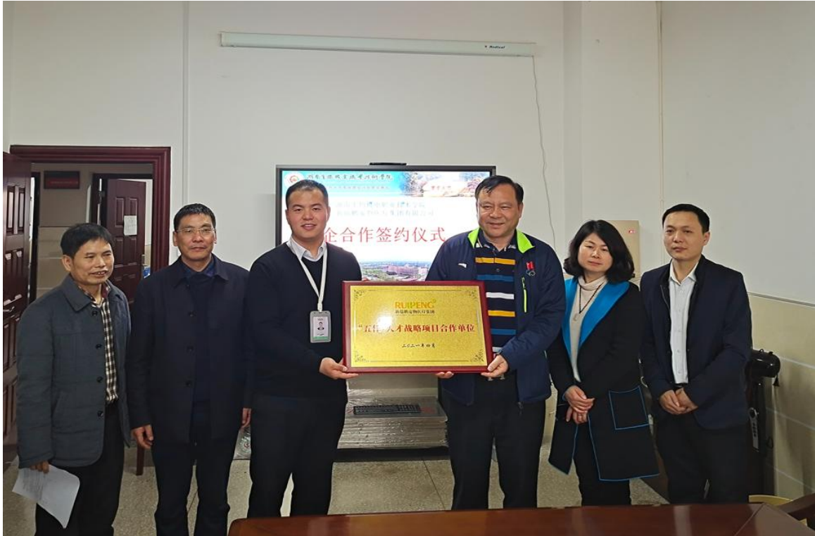
图 1 “五仟”人才战略项目签约

均每所学校输出 50 名学生，共计 5000 名适岗毕业生，与高校建立战略合作关系共同实施“五仟”人才战略项目。