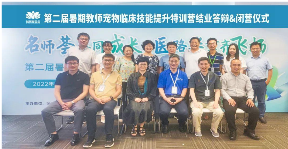
图5 暑期教师宠物临床技能提升特训班