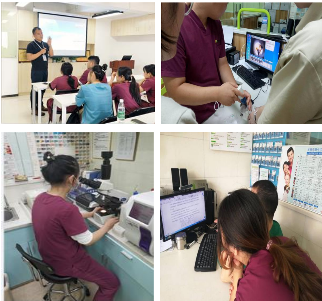
图3 一对一的线下技能强化训练