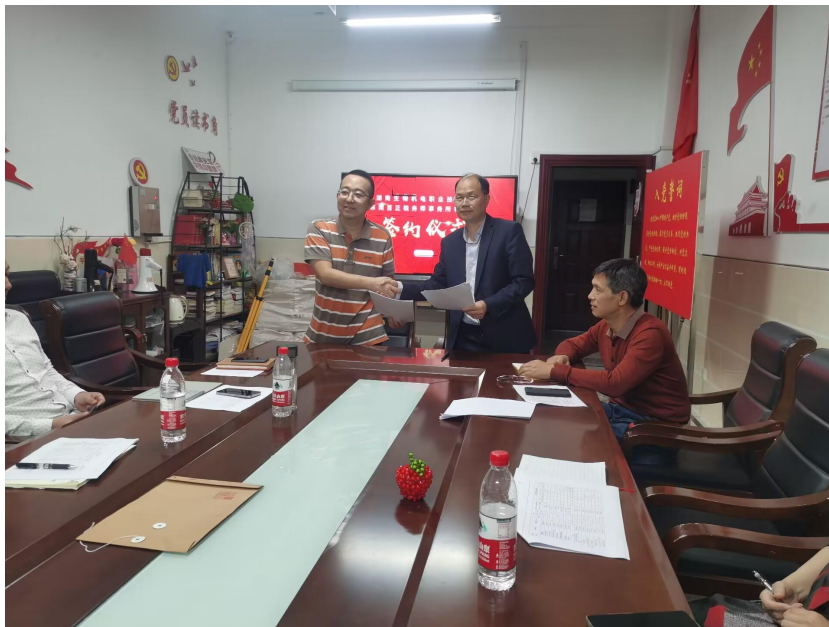
图 7 正式签订校企合作协议

2023 年湖南生物机电职业技术学院与东莞百正税务师事务所有限公司正式签署合作协议，共同建设大数据与会计实习实训基地，共建大数据与会计专业，实现校企双主体育人。