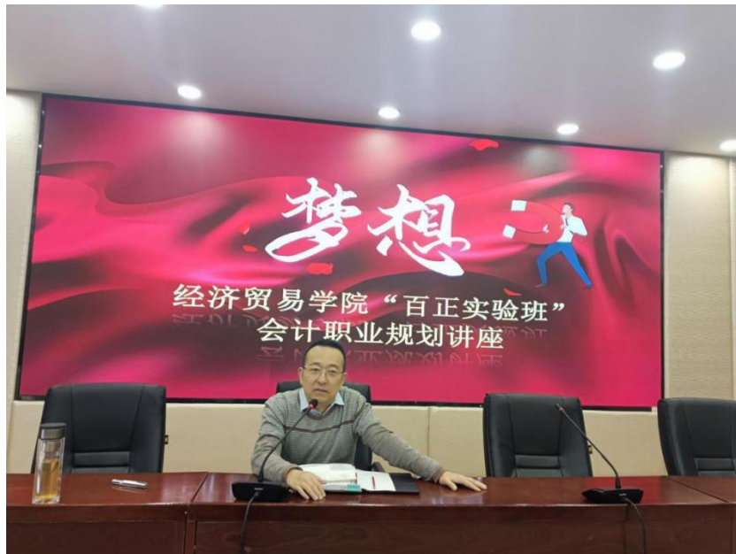
图 8 企业专家谈职业规划

才供需关系，从市场需求、高校培养、个人发展三个方面全面剖析会计职业发展规划，并对我院学生职业规划提出建议。