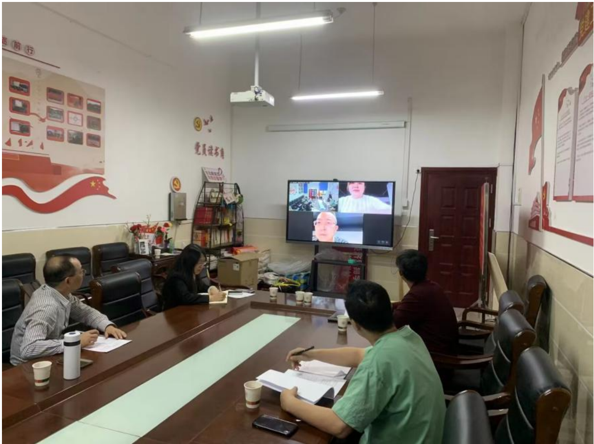
图 1 网络调研会议

2022 年，鉴于东莞百正税务师事务所有限公司近几年在湖南生物机电职业技术学院毕业生招聘会中招收了会计专业毕业生就业，与我校经济贸易学院在就业领域有合作。2022 年由于疫情影响，经济贸易学院与该公司采用网络会议、电话、网络查询等方式进行考察。