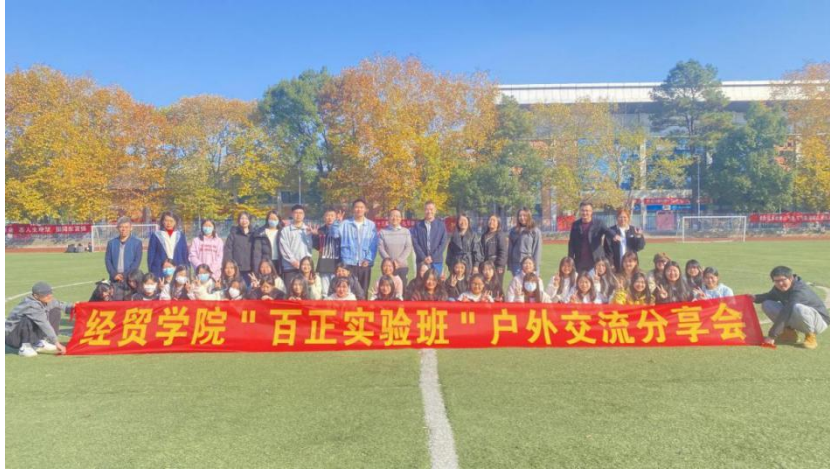
图 10 企业进校园开展户外交流

学习到课外实践上转变，在分享中强调，课外活动开展及参与同样能助力职业发展，通过在活动参与中展示自己也能让今后在职场中展现头角，要争做全面发展的人。