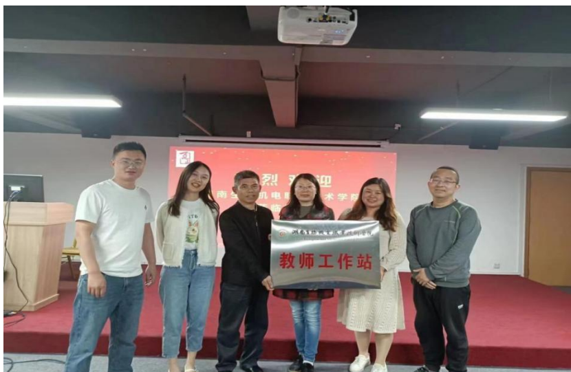
图 11 设立教师工作站

2023 年，校企合作建立教师工作站，加强学院师资队伍的培养工作，以“教师工作站”授牌为契机，鼓励专业教师赴站进修，同时支持和鼓励企业技术人员赴学校担任兼职教师或职业规划导师，打造双师型教师培养基地；推动校企双方协同育人，建立实训基地，提升实践教学能力和人才培养质量。“教师工作站”的建立，是我院落实国家提质培优计划，响应学校实施“双师型教师培训基地”培育建设工作的重要举措。