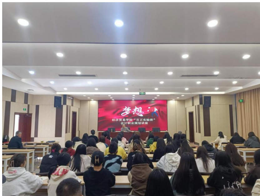
图 9 企业专家谈职业规划

2023 年 12 月，经济贸易学院“百正实验班”在东湖校区田径场同东莞百正税务师事务所有限公司开展户外交流分享会。由东莞百正税务师事务所有限公司副总经理路正丹跟同学们作职场经验分享，告诉同学们从学业