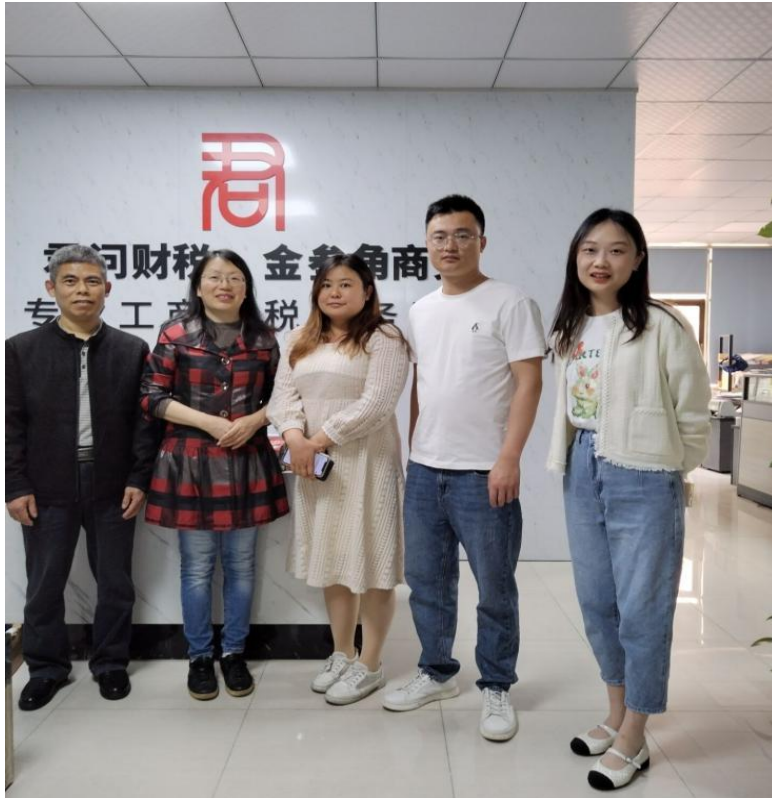
图 4 考察企业