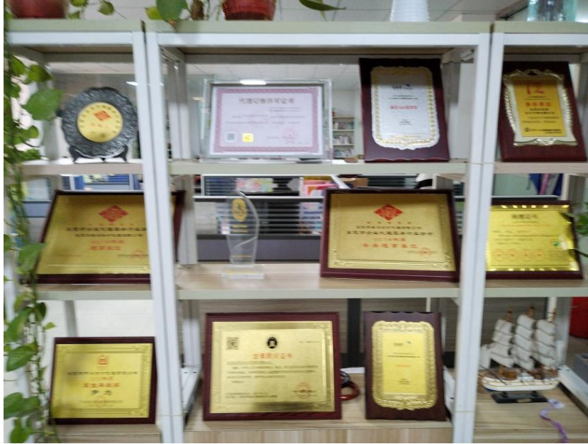
图 6 企业联盟获奖证书

2023 年湖南生物机电职业技术学院与东莞百正税务师事务所有限公司正式签署合作协议，共同建设大数据与会计实习实训基地，共建大数据与会计专业，实现校企双主体育人。