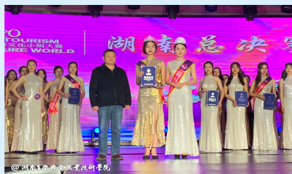
学生参加世界旅游文化小姐大赛获奖

可获得职业资格证书： 全国导游员资格证书、研学旅行策划与管理职业技能等级证书等。