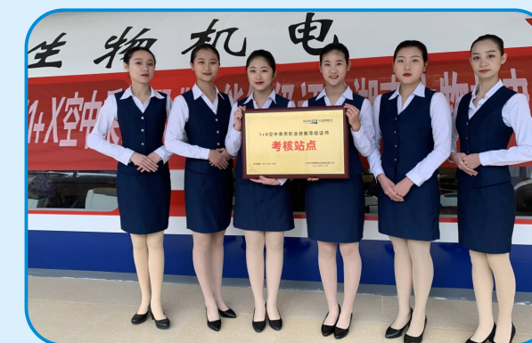
全国1+X空中乘务职业技能等级证书考核站点