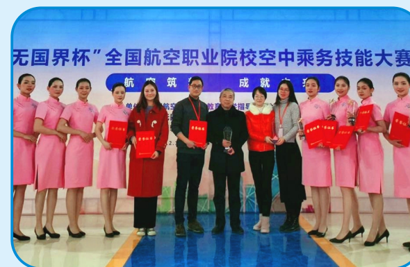
学生参加全国技能大赛获奖

本专业主要面向国内外航空公司、大中型机场及航空延伸服务企业管理与服务部门。培养具有一定的科学文化知识和人文素养，良好的职业道德、精益求精的工匠精神，较强的就业能力和可持续发展能力，掌握化妆与形象塑造、民航客舱服务、客运及行李运输、安全检查服务和机场地面服务等专业技术技能，能够从事空中乘务、民航安检、地面服务以及商务或会务礼仪接待工作的复合型技术技能人才。