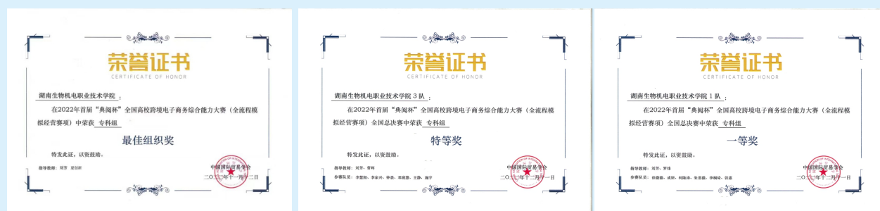
参加全国高校跨境电子商务综合能力大赛获奖