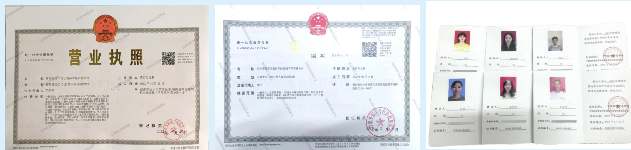
成立跨境电商工作室，孵化跨境电商公司