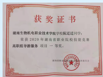
学生参加职业技能竞赛获奖