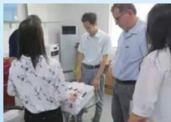
学生在外贸企业实习工作