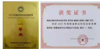
2021年湖南省职业院校技能竞赛一等奖

主干课程： 国际贸易实务、国际市场营销、商务谈判、外贸函电、外贸单证实务、报关报检实务、跨境电子商务等。