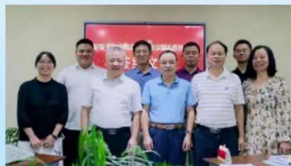
与校外实训基地签约授牌

本专业立足国家“一带一路”发展战略，主要面向外贸进出口公司、对外贸易管理机构、各大中小型企业、银行等企事业单位，培养能从事进出口贸易业务、制单跟单、报关报检、商务洽谈、文秘、营销和会计等岗位工作的高端技术技能型人才。本专业与湖南三十九铺茶叶有限公司、东莞瑞飞服装