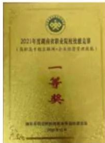
2021年互联网+企业经营管理技能一等奖