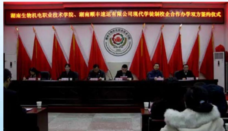
学院与湖南顺丰速运有限公司现代学徒制校企合作办学签约仪式