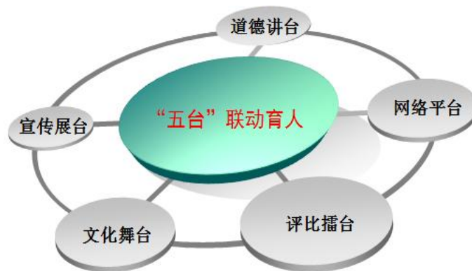
图1 支部搭建“五个”联动育人平台

建立“党支部-党小组-马克思主义学习小组”三级体系，构建课程教学、社会实践、宿舍文化和素质拓展“四个课堂”，搭建道德、宣传、文化、网络、评比“五个平台”，建设学习型党支部，引导青年学生在学习实践中领悟信仰之力、理想之光、使命之艰、担当之要（图1）。