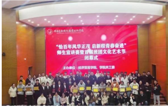
图4 支部开展“恰百年风华正茂 启新程青春奋进”师生宣讲大赛