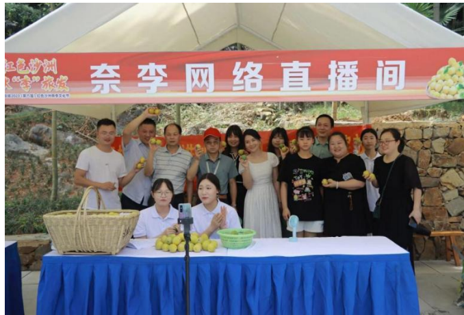
图3 支部赴郴州汝城开展直播助农社会实践