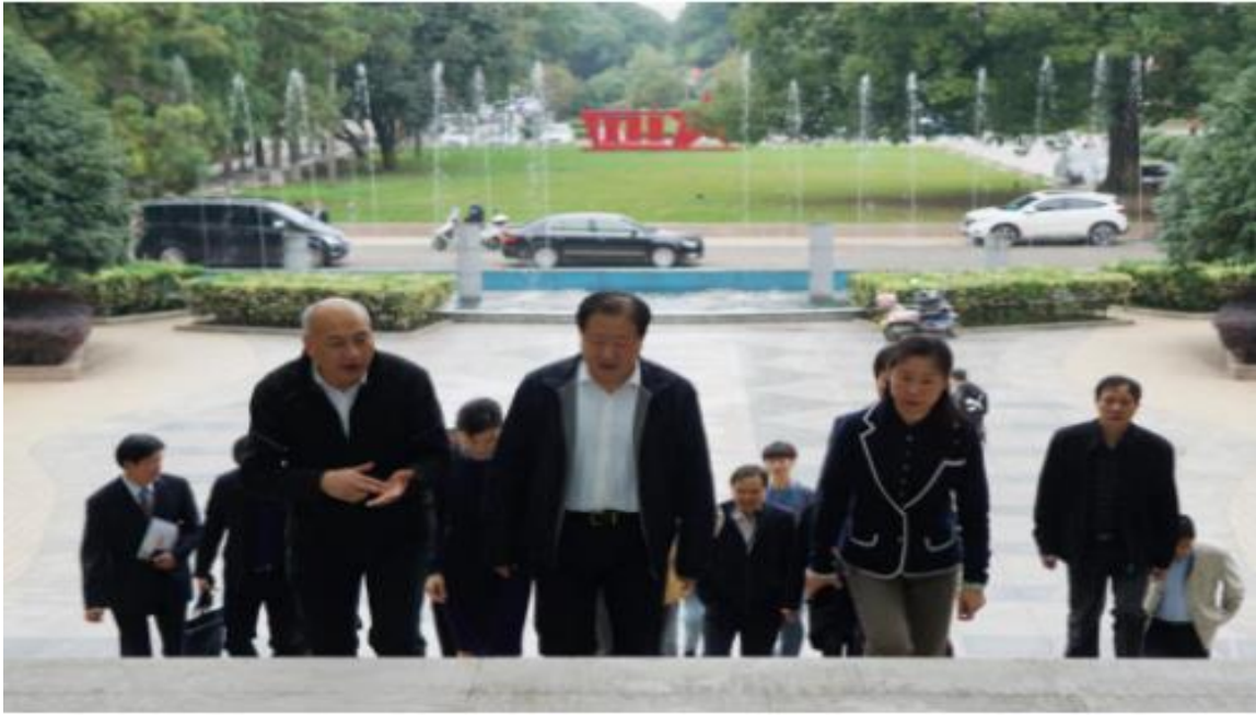
图2 农业农村部总农艺师广德福调研我校